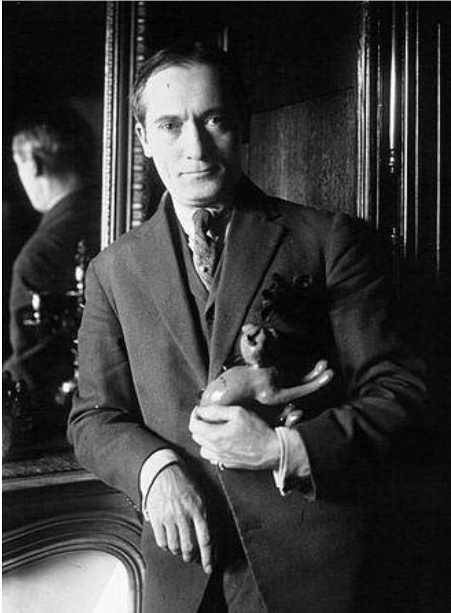
Maurice Dekobra en 1927

Mais revenons d'abord à la notion de 'middlebrow' pour ensuite placer Dekobra dans cette perspective.